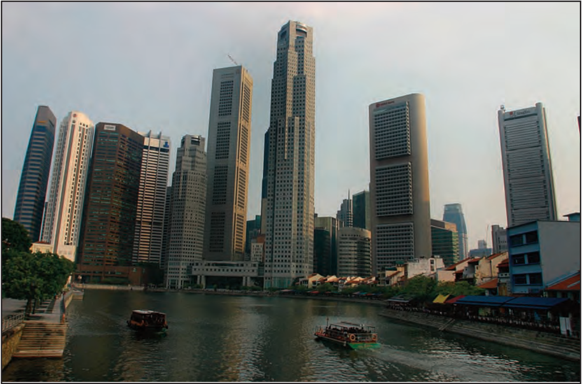
Skyskraperne tårnet over oss i Singapore, et av verdens mest moderne land. Her fra Clarkes Quay helt nede i sentrum.