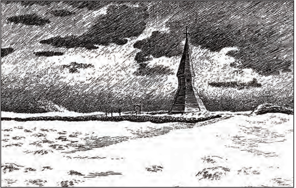
Th. Kittelsens kjente tegning av kirkegården på Røst.

Grå hus stod i klynger ved halvtørre viker som skar sig dypt inn i den flate øya. Veien var like god som noen kjørevei og buktet sig frem over sletten mot det lyse spiret på kirken.