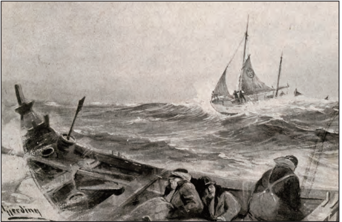
Det gamle postkortet forteller dramatisk historie fra Vestfjorden.

ikke engang greide å sette fast, så et par av skøytefolkene måtte hoppe ned til dem og hjelpe dem ombord til oss. I flere timer hadde de ikke kunnet røre en åre, og båten var halv av issørpe og snø. To av dem måtte bæres ned i kahytten. De 4 i den andre var heldigvis noe bedre, og med båtene på slep og 8 mann ombord hos oss, bar det innover.