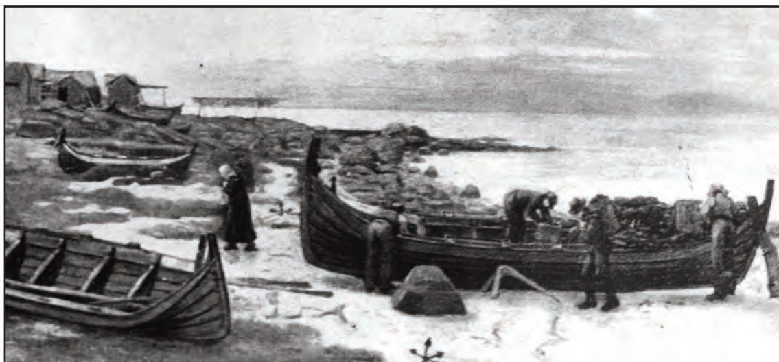
Båter i fjæra på Nordland. Bildet er malt av A. C. Tidemann rundt 1885. Så lenge fisket ble drevet med denne typen båter, var det gode havneforhold på Nordland. Det skulle endre seg da motoren kom.

nok var en bedre jordbruksgård enn prestegården på Værøy. Hele Måstadgrenda med sine 8 oppsittere var for øvrig skyldsatt til 3 vog.