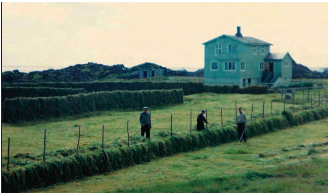
Høyberging i Kvalnes. Mye av slåtten foregikk i fjellet, men i Kvalneset hadde de etter Væroyforhold også god innmark.

Kvalnes, og vi vokste sånn sett opp med både jordbruk og fiskeri. Da jeg var ferdig på skolen, begynte jeg som egner. I 1952 var jeg med på mitt første vinterfiske ombord på fiskeskøyta «Ula».