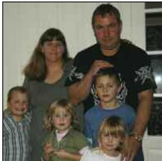
Familien på seks forlot storbyen København og flyttet til frihet og natur på Røst.

I de fleste kommunene i Nordland er folketallet synkende. Røst har klart å være en av få med befolkningsvekst. Og når en familie på seks flytter til en øy med drøyt seks hundre fastboende, så øker folketallet med 1% over natta.