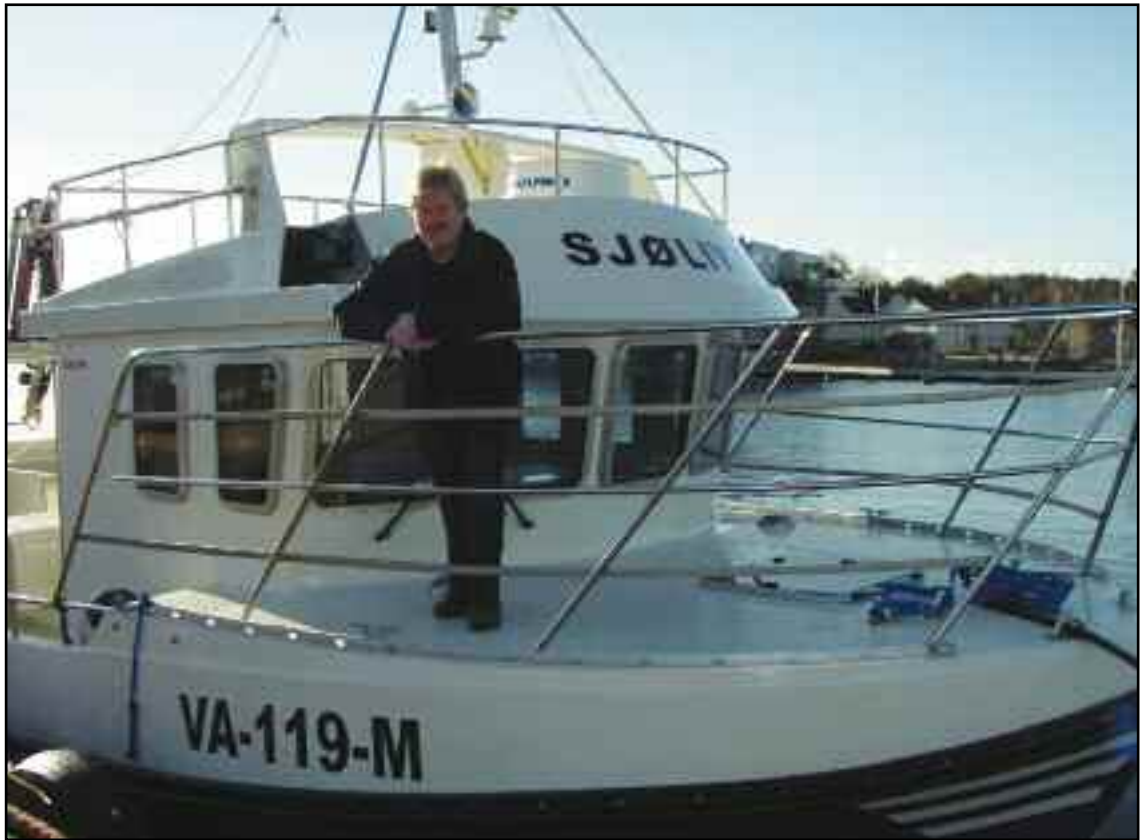
Nye "Sjøliv". med 500 hk Iveco og baupropell på 20 hk.

Det var flo sju og lett å komme i land. De første ustø skritt etter turen over Vestfjorden og møte med byen gjorde meg usikker. Da var det godt å holde i hendene til mamma og pappa. Vi kom opp på "støypveian". Det var store støyp- hus på rekke og rad. Ikke et gjerde eller ei gressmark å se, bare støyp og biler. Synes det var tungt å puste, var nok spent og litt redd.. Etter en tur på byen med mange inntrykk var det godt å komme "hjem" til lugaren om bord i Porlarlys.